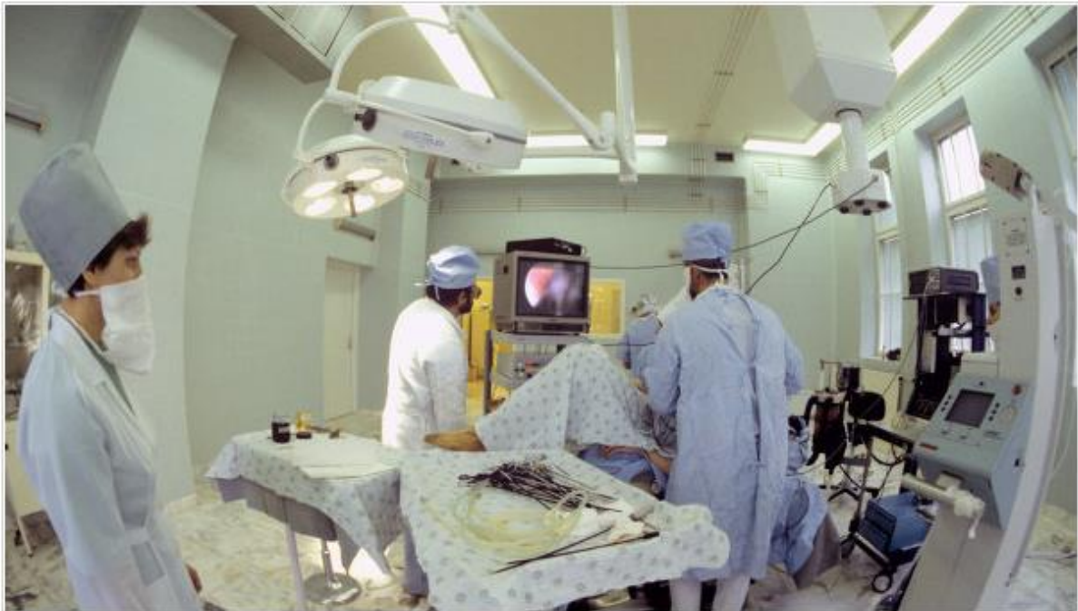
Rund eine Million Schwangerschaftsabbrüche 2012 in Russland - Auf zwei Geburten kommt eine Abtreibung